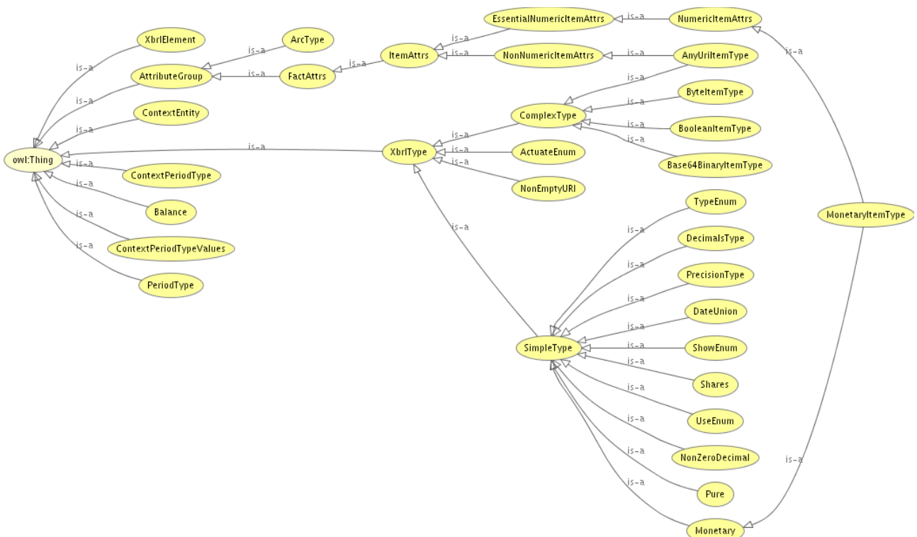
Figura 2: Ontología de Tipos de Datos

A modo de ejemplo se ha creado una ontología de tipos de datos. Una representación visual de esta ontología puede verse en la Figura 2.