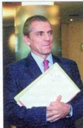
Manuel Contho, presidente de la CNMV

Otros proyectos tecnológicos que Nozal está liderando para la CNMV es la implantación de modificaciones derivadas de la inversión colectiva, el folleto de fondos de inversión o el de emisiones de renta fija.